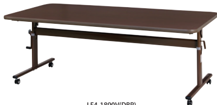
LF4-1890V(DBR) ダークブラウン JAN 131848