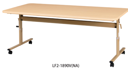
LF2-1890V(NA) ナチュラル JAN 131831