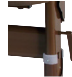
天板跳ね上げレバー