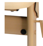
天板跳ね上げレバー